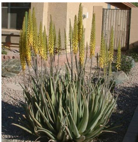
Aloe vera «Verdadera»

Multiplicación: por hijuelos, que nacen alrededor de la planta madre.